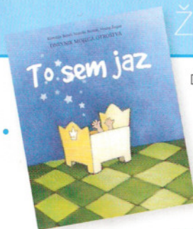
Dnevnik To sem jaz

V času nosečnosti in zgodnjega materinstva si privoščite malo več nege in razvajanja ter spremenite to posebno obdobje v najsrečnejše mesece svojega življenja!