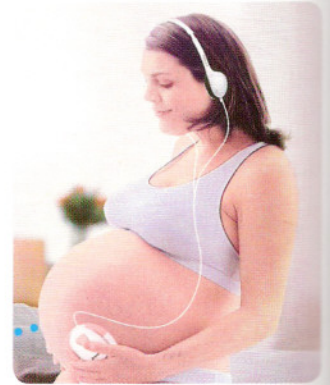
Naprava za poslušanje otroka v maternici Angelsounds

Bi si želeli slišati srčni utrip otročička, ki ga nosite v tebuhi? Kaj pa njegovo kolcanje? Nežni zvoki vas bodo še tesneje povezali z nerojenim otrokom.